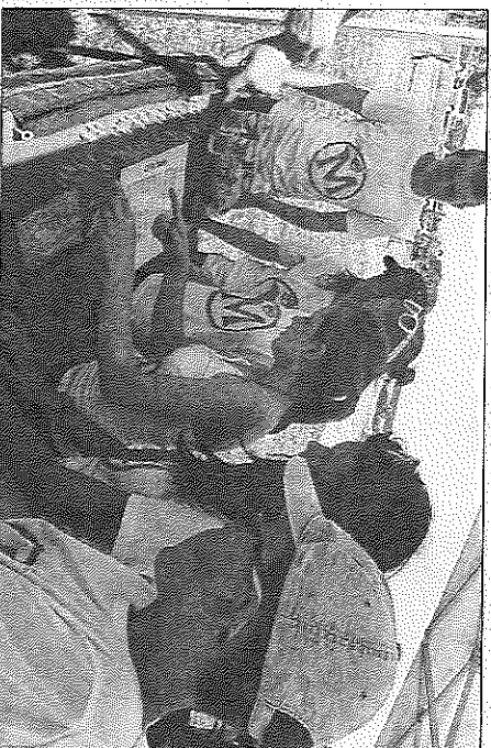
■ L'épreuve du Braille pour jeunes joueurs voyants.

Geste supplémentaire de solidarité, le fil rouge consistait en la réalisation d'objets, fleurs ou animaux, en origami, lesquels objets étaient ensuite vendus au public. La recette étant intégralement versée à la maison d'accueil spécialisée des autistes de Moyeu. Ainsi, sa directrice a-t-elle reçu plus de 300 euros dont une contri-