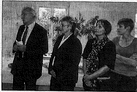
■ La direction de la maison d'accueil spécialisée a salvé la mobilisation autour de cet outil novateur.

Les stimulations sensorielles permettent de développer des compétences quand celles-ci sont atténuées, comme c'est le cas pour les résidents autistes de la maison d'accueil spécialisée Arlette Gruss. C'est pourquoi, la création d'une salle multi-sensorielle entièrement consacrée à favoriser diverses perceptions a-t-elle justifié une mobilisation.